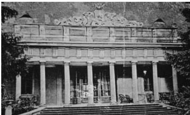
Molnárov kaštieľ sa nachádzal v západnej časti mesta v udržiavanom parku. Na jeho mieste dnes stoja bytové domy.